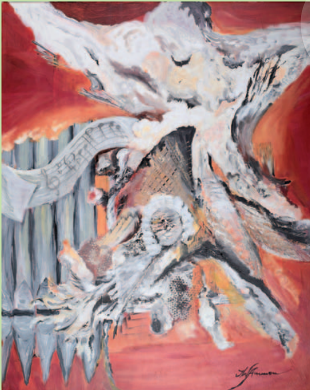
Ingrid Walter-Ammon Acrylmalerei www.ingrid-walter-ammon.de

29.04. bis 03.05.2020 Geranienhaus Schlosspark Nymphenburg München